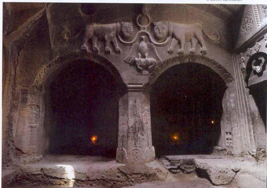
Une des salles taillées dans les roches de Guéghard, la colonne en haut est décorée d'un bas-relief de l'armoire princière avec des ornements et la croix dans le saint autel.