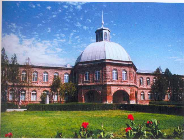
Séminaire Guévorkian de Saint Etchmiadine