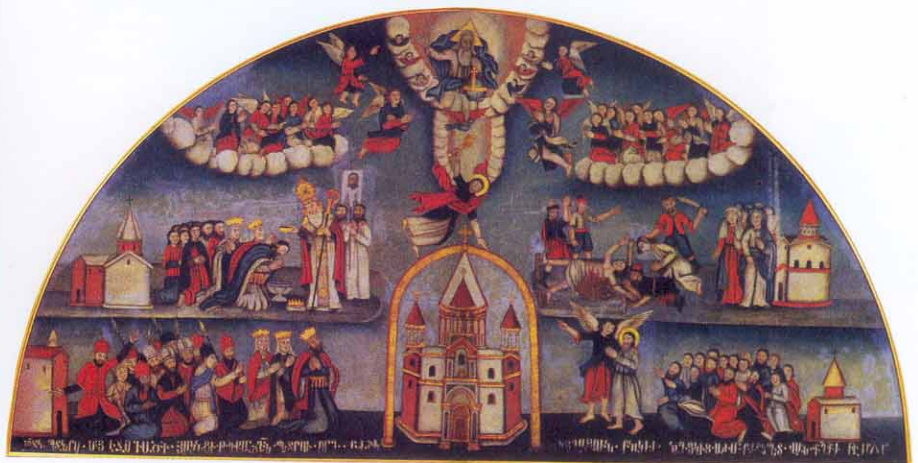
« La fondation de Saint Etchmiadine » (1834, peintre inconnu)