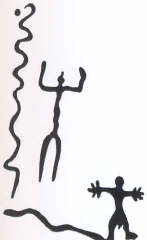
Scène de combat entre dieu du soleil et dragon dans les peintures rupestres (Baydassar, Oughdassar)