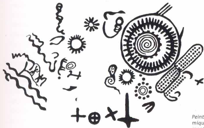
Peintures rupestres astronomiques vues du haut de la montagne Noire à Varténis