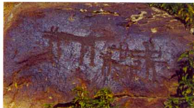
Les monts Guêghama

A ce propos l'astronome anglais William Olcott écrivit : « Les premiers à avoir représenté des constellations par des dessins ont probablement vécu dans la vallée de l'Euphrate, ainsi qu'autour du mont Ararat. »