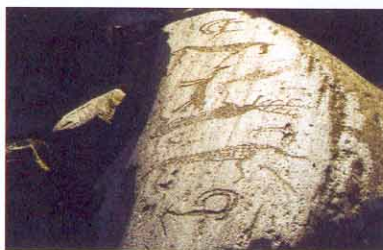
Le mont Oughtassar

Sur d'autres peintures, on peut reconnaître des roues de chars de guerre et de charrette à deux ou quatre roues, ce qui montre que ces objets ont été créés en Mésopotamie