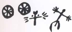
Dieux-hommes de foudre